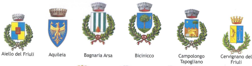
Aiello del Friuli